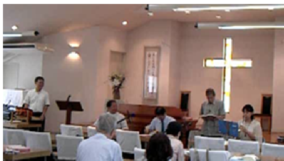
和洋楽器演奏で歌うWさん