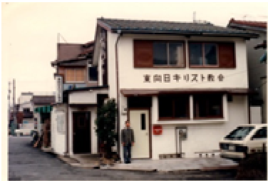
上：二枚田の旧教会。下：現在の教会