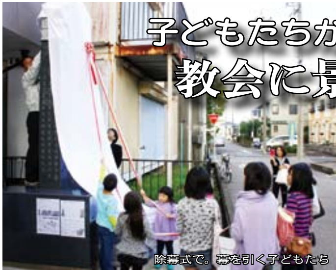
除幕式で。幕を引く子どもたち