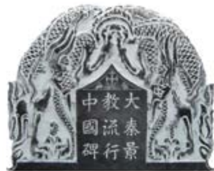
写真上＝大秦景教流行中国碑の拓本 写真左＝除幕式で祝辞を述べる日本景 教研究会メンバーの湯澤英房氏（パプ 宣教団・東向日キリスト教会牧師）

景教碑が、日本景教研 究会本部(川口彦代表) を兼ねた愛知福音キリス ト教会(愛知県春日井市 柏井町7ノ2ノ6)に建 ち、11月3日、除幕式が