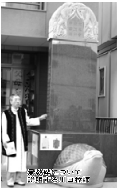
景教碑について説明する川口牧師